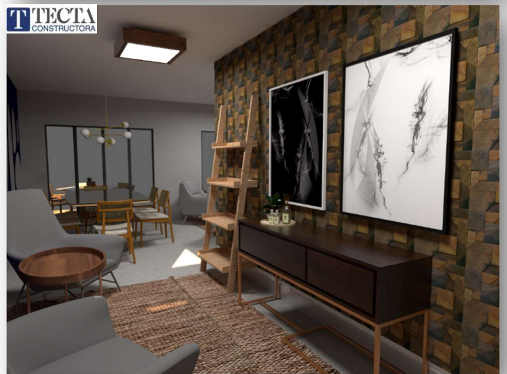
Vistas referenciales de interiores.